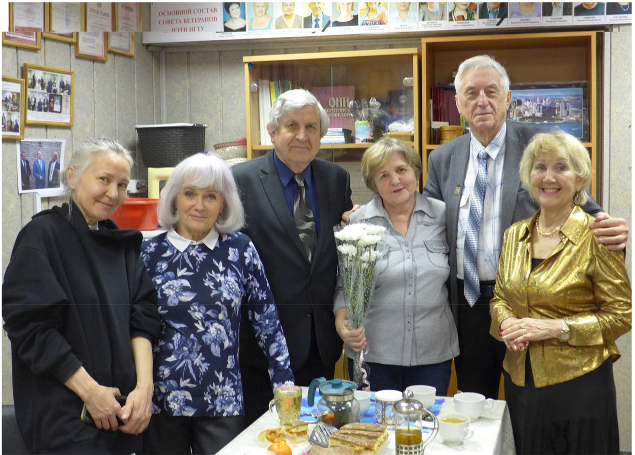
Те же, но смена фотографов...