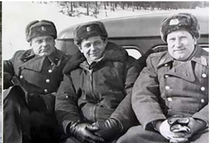
Ангарск. С сослуживцами