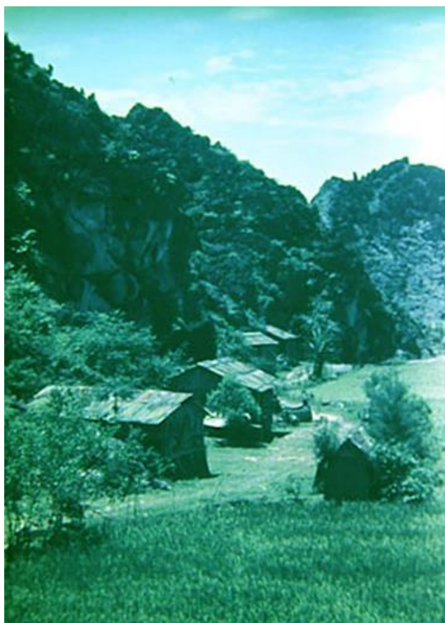
Долина Нуй Вой