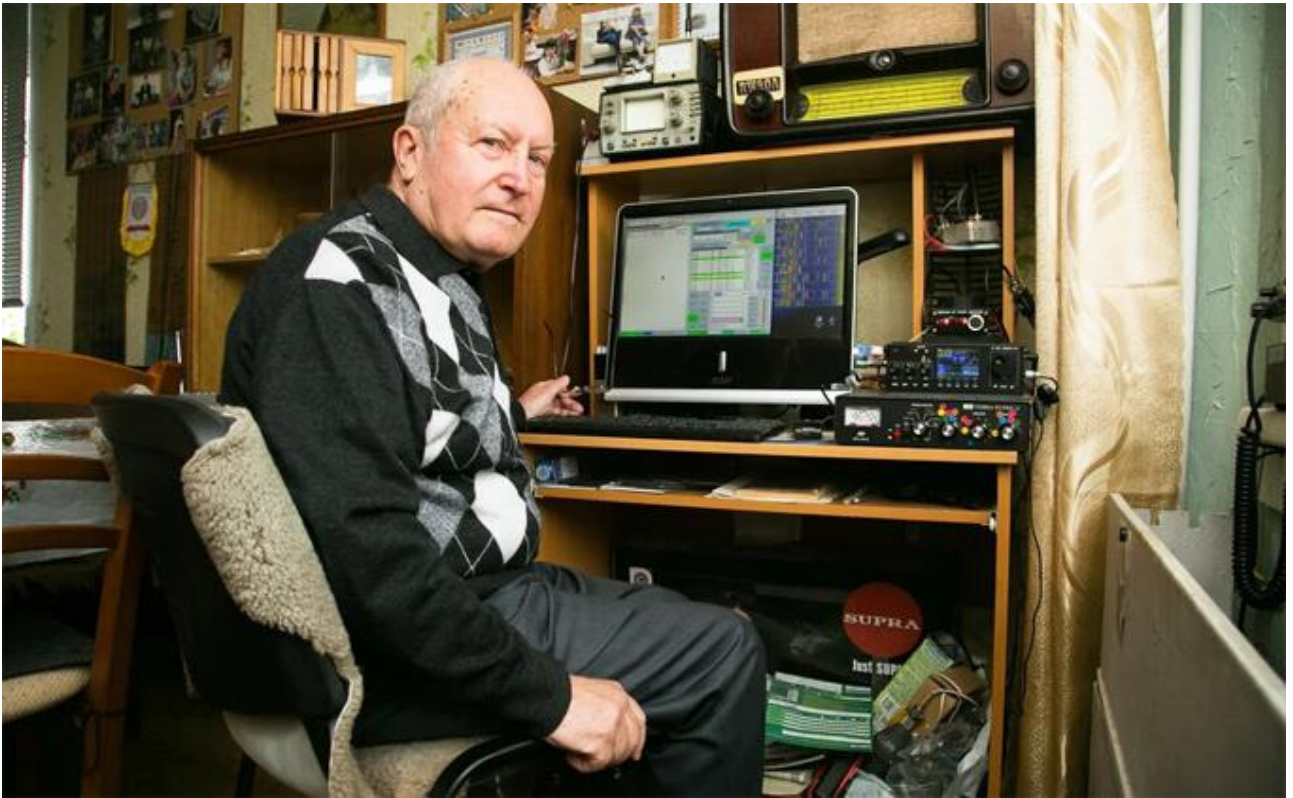
В домашней радиолaborатории...