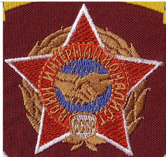
Почетный знак «Общество Российско-Вьетнамской дружбы» (слева). Знак «Воин-интернационалист СССР»