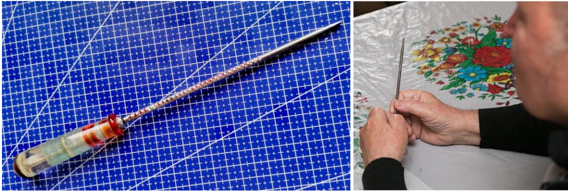
Отвертка из Вьетнама с 34 зарубками по числу сбитых самолетов США