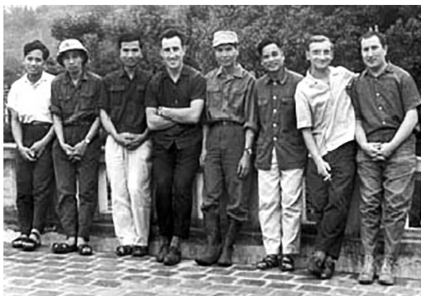
С Вьетнамскими коллегами