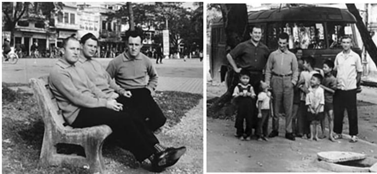
Вьетнам. Хайфон. На площади