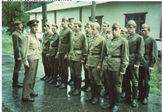
В НЭТИ НГТУ