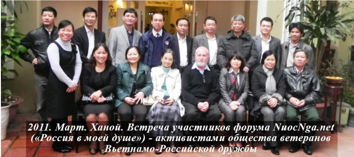
2011. Март. Ханой. Встреча участников форума NiocNga.net («Россия в моей душе») - активистами общества ветеранов Вьетнамо-Российской дружбы