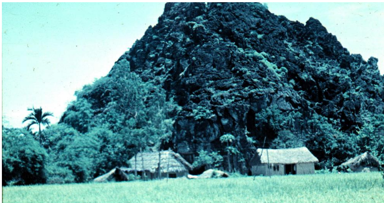
Нуй Вой. База, где жили русские военнослужащие