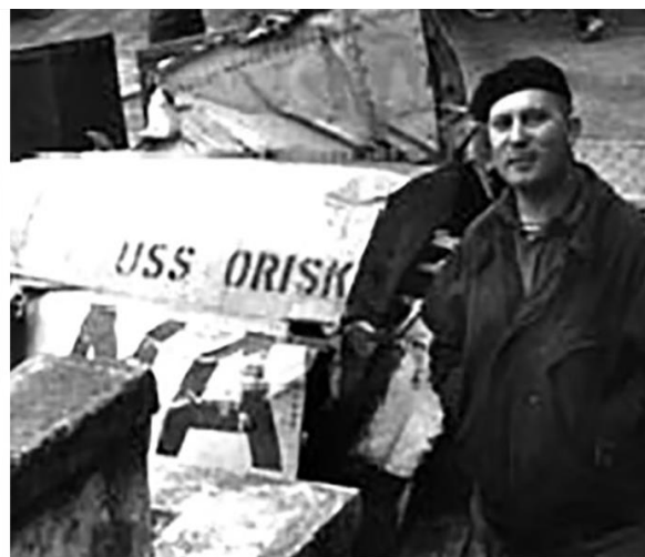
У американского сбитого самолета...