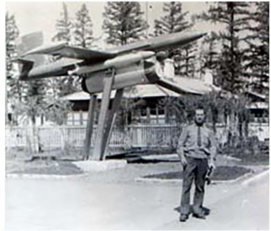
Полигон Телемба (Читинская область)