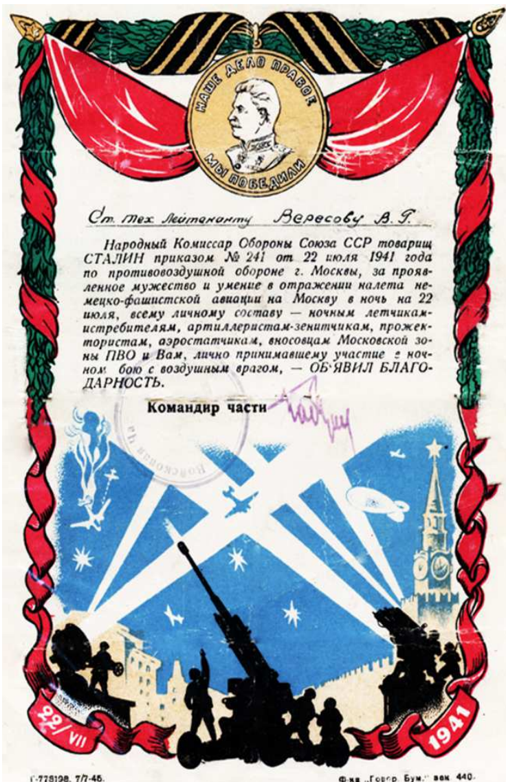
Благодарность от товарища СТАЛИНА