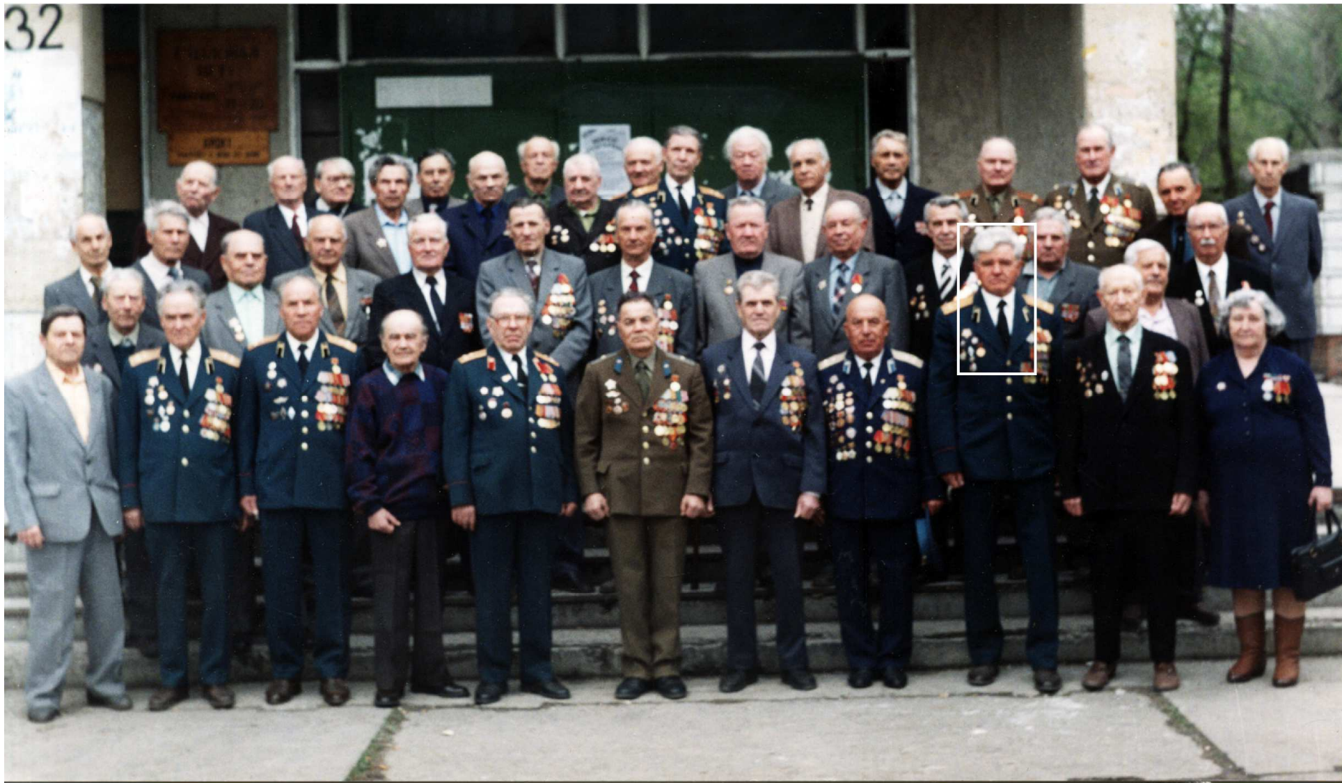
6 мая 1997 г. Участники ВОВ у III корпуса

1 – Алюминиевая ложка, спутница военных дней. 2 – Погоны подполковника. 3 – Фотография участников ВОВ.