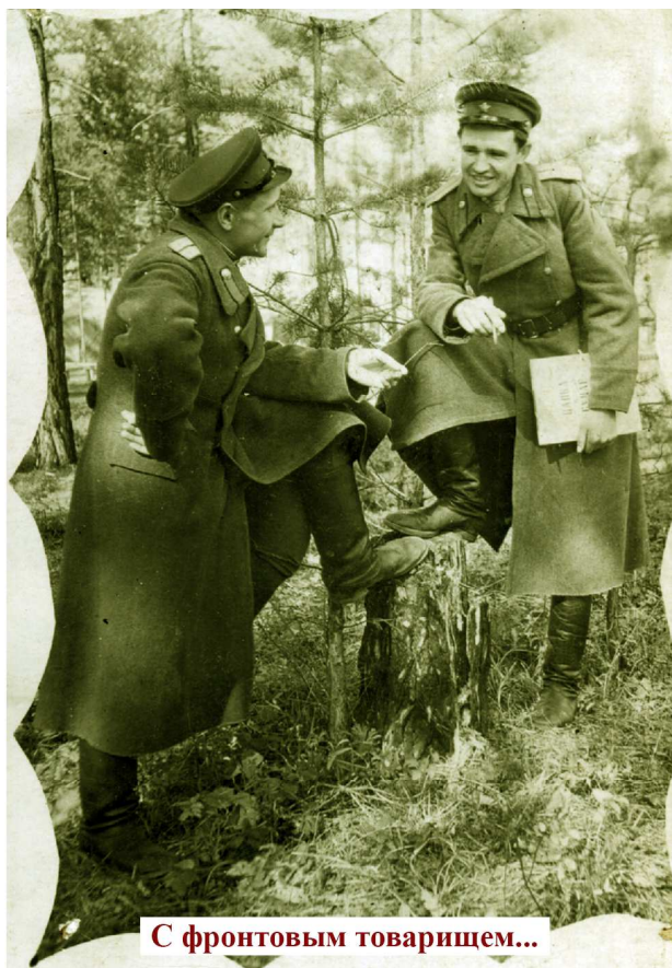
С фронтовым товарищем...