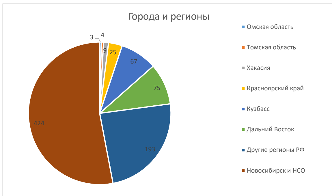
Рисунок 1 Распределение ответов на вопрос «Укажите откуда вы?»

В качестве ответа на данный вопрос необходимо было выбрать место проживания. Исходя из этого ответа можно было выявить целевую аудиторию поступивших в университет.