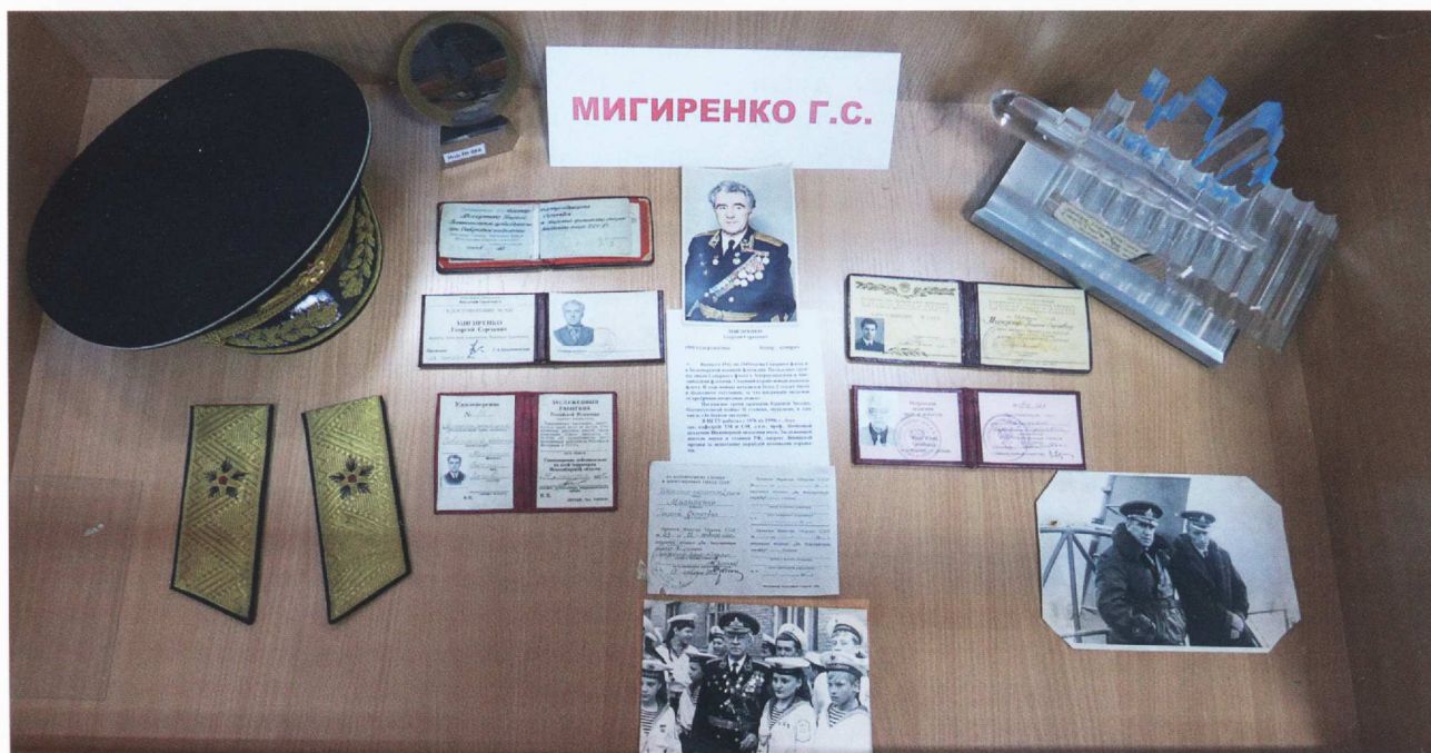
В музее НГТУ