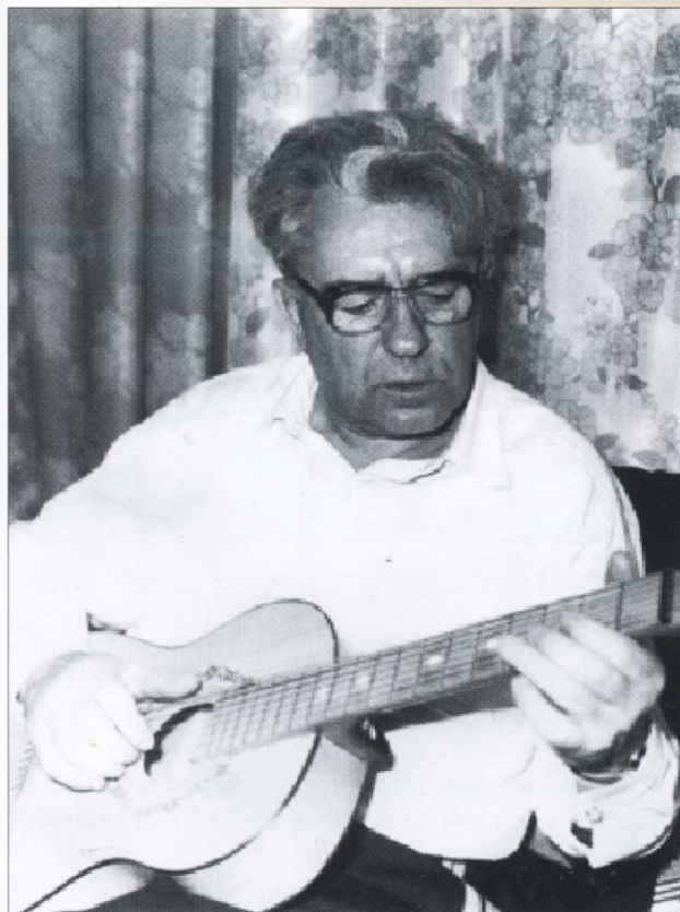
Самые теплые строки посвящены маме и предкам.

За год до смерти он подарил мне свой сборник стихов «Мечты и явь соединяя...» (Новосибирск. – 1988. – 71 с.). По его признанию, стихи он начал писать ещё в детстве, но и в преклонном возрасте сохранил благодарность в стихах ко всем встретившимся на его пути людям.