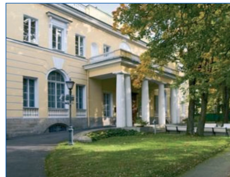
НАУЧНЫЕ РОТЫ – СТР. 4