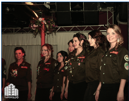
СТУДЕНЧЕСКИЕ ОТРЯДЫ – СТР. 6