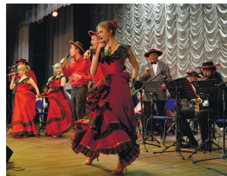
КОНЦЕРТ-ПРЕЗЕНТАЦИЯ ЦЕНТРА КУЛЬТУРЫ СТР. 5