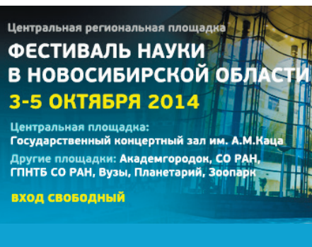
ФЕСТИВАЛЬ НАУКИ СТР. 2