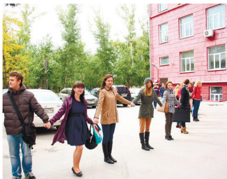
ОБНИМИ СВОЙ УНИВЕРСИТЕТ СТР. 3