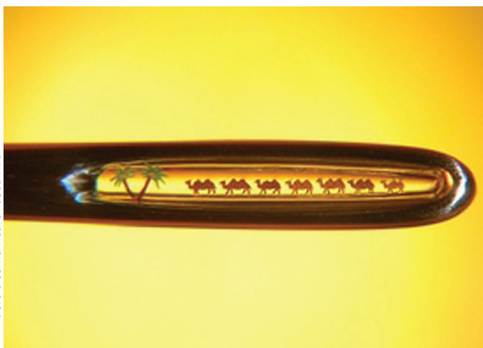
«Верблюды в игольном ушке», микроминиатюра Владимира Анискина

Новосибирский государственный художественный музей (Свердлова, 5)