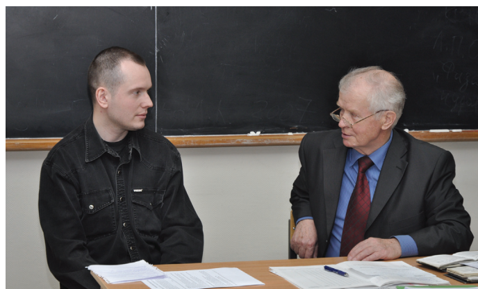
Экзамены на ФЛА