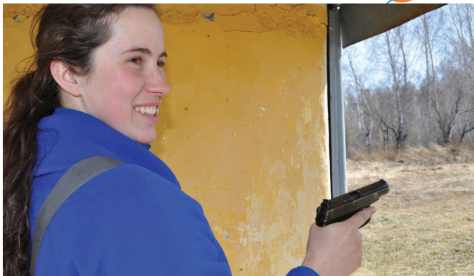
После экскурсии отправились на сам полигон, где гостям была предоставлена уникальная возможность – выстрелить по 6 раз из пистолета Макарова и проверить свой результат.