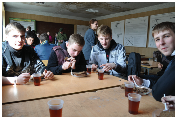
Вряд ли студенты скоро забудут этот насыщенный, полный новых впечатлений день.