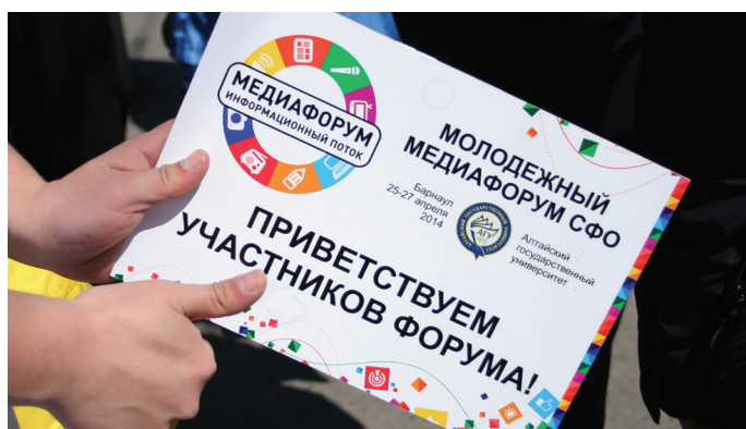
Фото участников Медиафорума

После практики был еще один вебинар – с Константином Панфиловым, главным редактором издания «Цукерберг звонит». Он дал советы начинающим журналистам: «Нужно быть глупыми, ленивыми, безграмотными и не уметь учиться на своих ошибках. Это очень важно, чтобы не стать крутым журналистом. Если вы будете много читать, постоянно писать, докапываться до сути, искать дополнительную информацию, будете дотошными людьми, то вы станете успешными журналистами».