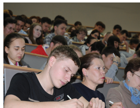
ТОТАЛЬНЫЙ ДИКТАНТ СТР. 7