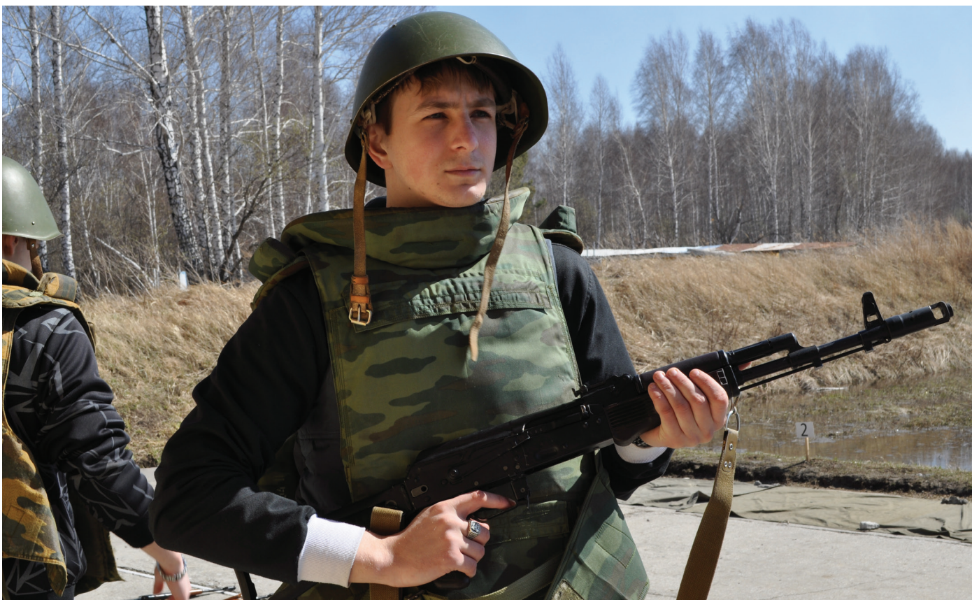
Следующие этапы – стрельба лежа из пулемета и с колена – из автомата Калашникова. Прежде чем стрелять, необходимо надеть бронезилет и каску.