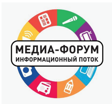
МЕДИАФОРУМ СФО СТР. 8