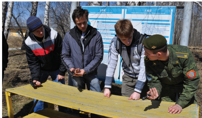
Стрелять из настоящего боевого оружия не так просто, как кажется на первый взгляд. Поэтому все участники должны были пройти подробный инструктаж и прослушать лекцию о технике безопасности.