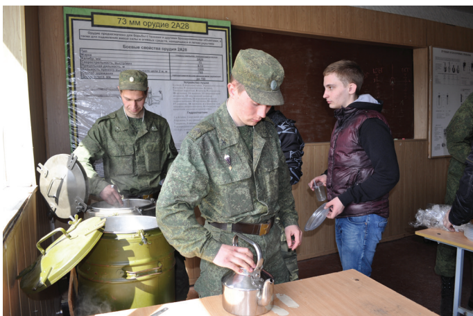
А завершилась необычная экскурсия обедом в настоящей полевой кухне.