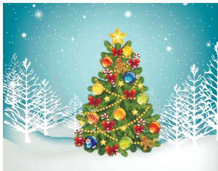
ЗИМНЯЯ СЕССИЯ СТР. 3