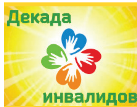
ДЕКАДА ИНВАЛИДОВ В ИСР СТР. 2