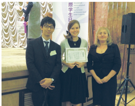
ВСЕРОССИЙСКИЙ КОНКУРС ПО ЯПОНСКОМУ ЯЗЫКУ СТР. 3