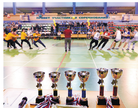
ИТОГИ ОБЛАСТНОЙ УНИВЕРСИАДЫ СТР. 7