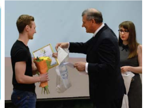
ПРЕМИЯ «ПРОМЕТЕЙ» СТР. 3