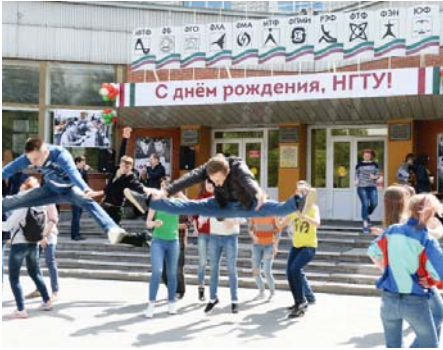
ДЕНЬ НГТУ СТР. 3