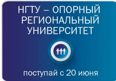
ПОСТУПАЮЩИМ СТР. 12