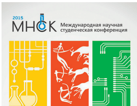
МНСК-2015 СТР. 2