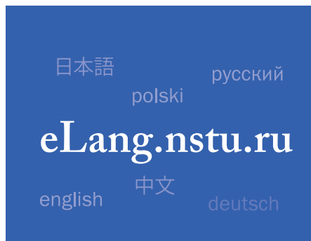
УЧИМ ИНОСТРАННЫЕ ЯЗЫКИ ОНЛАЙН СТР. 3