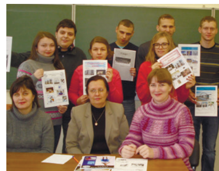
ДЕКАДА ИНВАЛИДОВ В ИСР СТР. 4