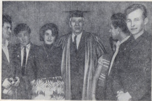
Н. И. Чуковский сфотографировался с нами в треуголке и в мантии доктора Оксфордского университета...