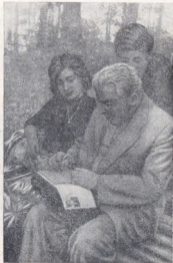
Книжка с надписью И. Сельвинского займет почетное место в библиотеке