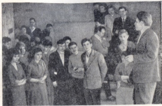
В перерывах стихи звучали и на лестничных клетках

И, чеканя шаг, через весь зал торжественно проходят воины сибирского гарнизона. Через минуту они застывают у портретов.