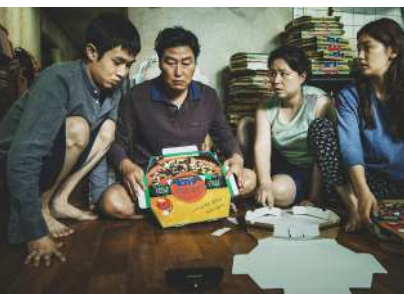
«ПАРАЗИТЫ» (2019), реж. П. ЧЖУН ХО

происходит в 1945 году, война вот-вот должна закончиться, но судьба мужа Грейс, ушедшего на фронт, до сих пор неизвестна. Спустя несколько дней в дом заселяется прислуга из трех человек. Но с их приходом жизнь в доме становится просто невыносимой. Откуда звучит детский плач или игра на рояле? В доме явно кто-то есть, помимо настоящих жителей, и как же найти виновника?