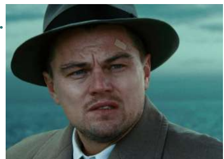
«ОСТРОВ ПРОКЛЯТЫХ» (2010), реж. М. СКОРСЕЗЕ

Культовый фильм ужасов, о котором знают многие. Кинокартина медленно раскачивается, погружая нас в атмосферу отеля, показывает каждый его угол. Зритель наблюдает, как писатель Джек Торренс постепенно сходит с ума, а Венди, его жене, становится все страшнее и страшнее находиться в обществе мужа. Кинолента 1980 года, но все еще умело воздействует на страхи зрителя.