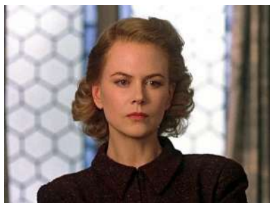
«ДРУГИЕ» (2001), реж. А. АМЕНАБАР

Пугающая история о женщине по имени Грейс, которая переехала со своими детьми Энн и Николасом в старинный особняк. Действие