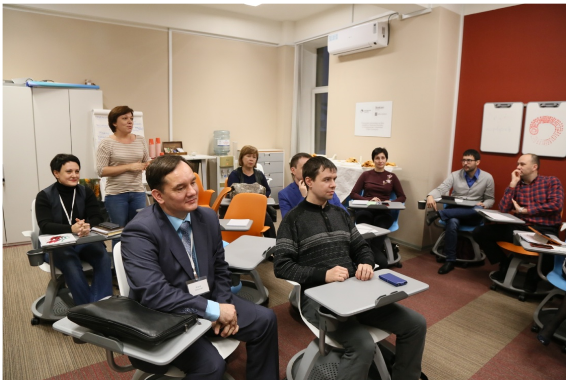
Фото-материалы: обучение проектному управлению на базе Московского Политеха.