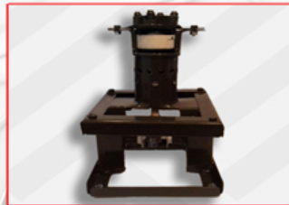
БИНАРНЫЙ ДВИГАТЕЛЬ ВНУТРЕННЕГО СГОРАНИЯ.