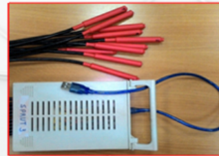
МНОГОКАНАЛЬНАЯ СИСТЕМА РЕГИСТРАЦИИ И ХРАНЕНИЯ ДАННЫХ О ТЕМПЕРАТУРЕ СРЕДЫ.